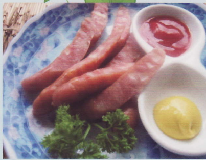
ソーセージ盛合せ ¥600